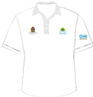
Imagen 4. Playera tipo polo Caballero