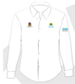
Imagen 5. Camisa ejecutiva manga larga