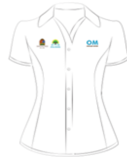
Imagen 3. Blusa ejecutiva manga corta