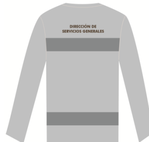
Imagen 7. Playera tipo dry fit (dama y caballero)