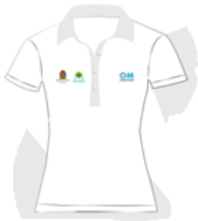
Imagen 1. Playera tipo polo Dama

ADQUISICIÓN DE UNIFORMES PARA EL PERSONAL ADMINISTRATIVO AL SERVICIO DEL GOBIERNO DEL ESTADO.