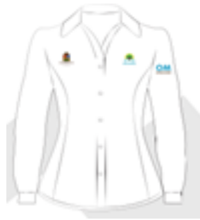
Imagen 2. Blusa ejecutiva manga larga