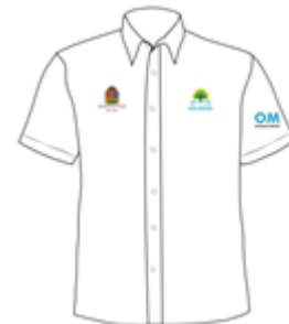
Imagen 6. Camisa ejecutiva manga corta